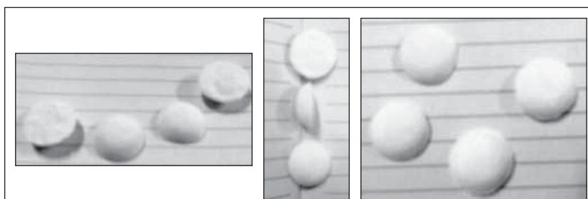
Рис. 2. Формы лиофилизированных таблеток под разными углами Fig. 2. Dosage form of freeze-dried tablets at different angles