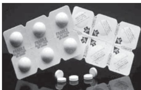
Рис. 1. Упаковка Zydis ® Fig. 1. Zydis ® packaging

Таблетка растворяется почти мгновенно при помещении ее на язык, освобождая включенное ЛС. Весь процесс сублимационной сушки выполняется при низких температурах, поэтому устраняются неблагоприятные тепловые эффекты, которые могут влиять на стабильность ЛС во время обработки. Yagwood (1990) запатентовал процесс подготовки лиофилизированной таблетки, в которой ФС была физически захвачена или растворена в матрице быстрорастворимого носителя. Процесс лиофилизации, как известно, включает удаление воды путем сублимации замороженной жидкости, включающей в себя смесь ЛС, матрицы и другие ВВ, заполненные в предварительно сформированные блистерные карманы [13]. Образованная матричная структура сильно пористая и быстро распадается при контакте со слюной [14].